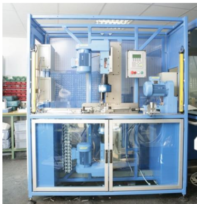
Maschine für die Gewindebearbeitung

den Umstieg auf 3D. Der Konstrukteur im Unternehmen, der bereits Erfahrung mit verschiedenen CAD-Programmen hatte, riet seinem Arbeitgeber zu SolidWorks.