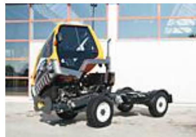
Kippbare Kabine für Wartungsarbeiten

Der Unitrac ist nicht nur der erste Designtransporter, sondern bietet auch technische Highlights, wie die ohne Werkzeugeinsatz seitlich um 50 Grad kippbare Kabine.