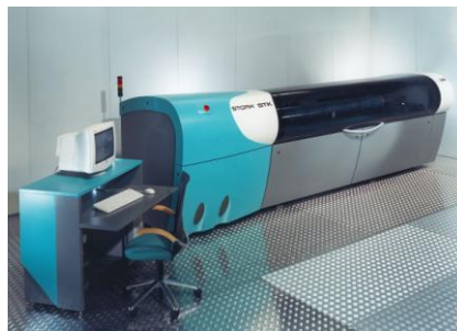
Redesign eines Laser Engraver für die Firma Stork STK Kufstein

Kunden von Kiska Creative Industries zählen bekannte Namen wie die Motorradhersteller KTM und Moto Guzzi, Silhouette-Brillen, die Österreichischen Bundesbahnen, Siemens, Skihersteller Blizzard, AVL Graz oder Audi.